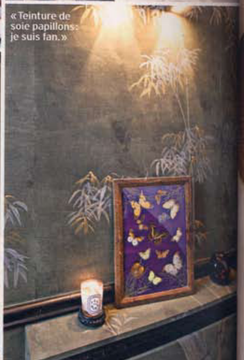
« Teinture de soie papillons: je suis fan. »