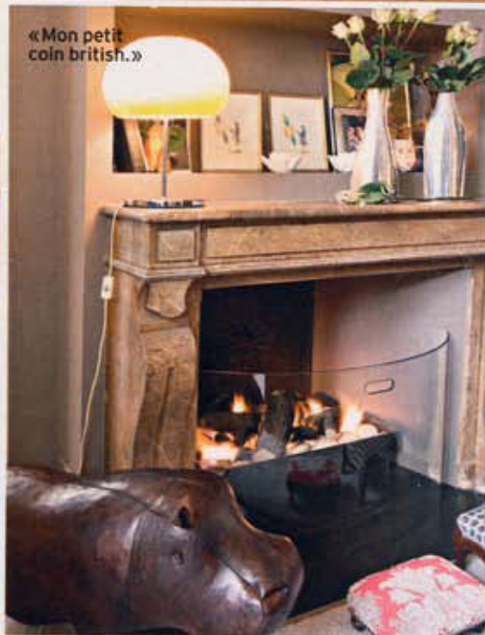
« Mon petit coin british. »