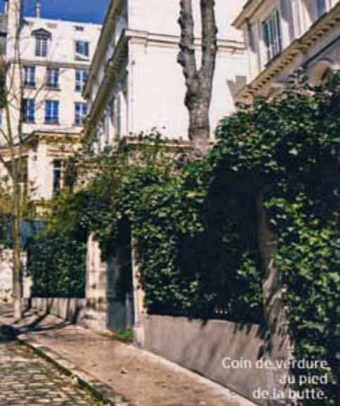
Coin de verdure au pied de la butte.