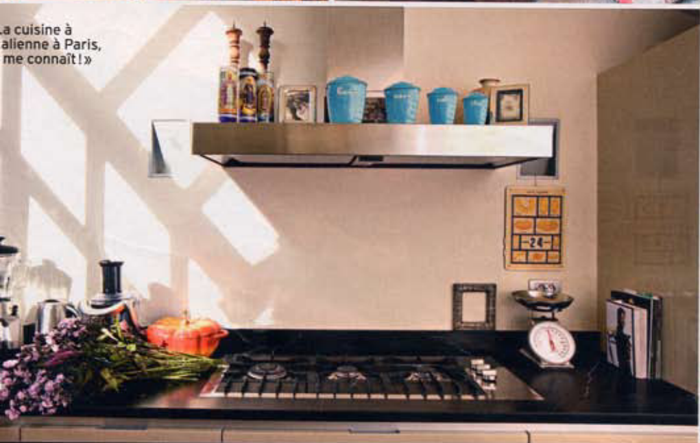
« La cuisine à l'italienne à Paris, me connaît! »