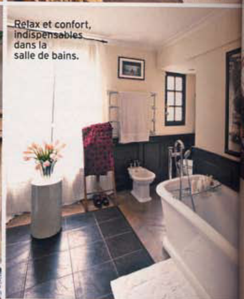
Relax et confort, indispensables dans la salle de bains.