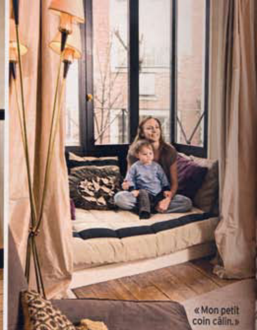
« Mon petit coin câlin. »