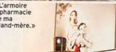
L'armoire pharmacie de ma grand-mère.»